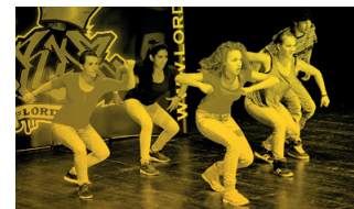
Lordz Dance Academy Ceilidh – ein Tanzfest

Lesung biblischer und koranischer Texte zum Frieden. Die Texte werden musikalisch umrahmt von der jüngsten Generation (mit teilweise erst 11-jährigen MitspielerInnen!) des Zürcher Stringendo Ensembles, dem Streichensemble „Stringendo4kids“ unter der Leitung von Jens Lohmann und Susanna Unseld.