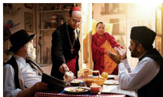
ZIID am Mittagstisch Religion und Gewalt

Die Politiker sind aufs Wirtschaftswachstum fixiert. Das ruiniert den Globus. Studien der Glücksforschung belegen, dass die menschliche Zufriedenheit von anderen Faktoren abhängt als denen, die in der Wirtschaft eine Rolle spielen. Viele haben den Umbau bereits begonnen. Ein Abend mit dem Denklabor «Danach».