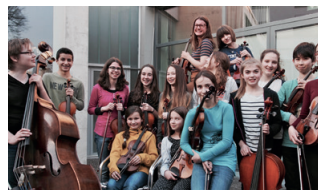
ZIID im Konzert Religion und Frieden

Fr / 7.10.2016 / 19:30 Uhr Mehrzwecksaal